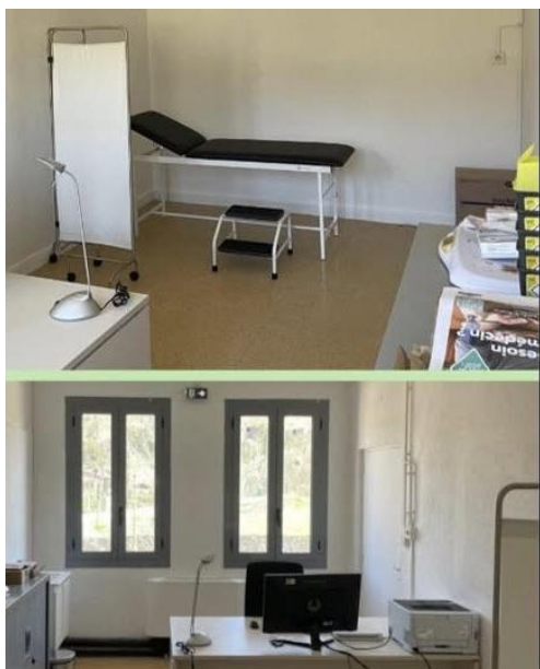
U Riscamunicu n°25

https://www.maiaa.com/cabinet-medical/20235-castello-di-rostino/centre-castello-di-rostino