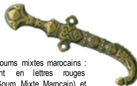
Insigne général des goums mixtes marocains : une koumia, portant en lettres rouges l'inscription G.M.M (Goum Mixte Marocain) et décoré de motifs géométriques et floraux.

Allez savoir, peut-être est-ce un Tabor Marocain !