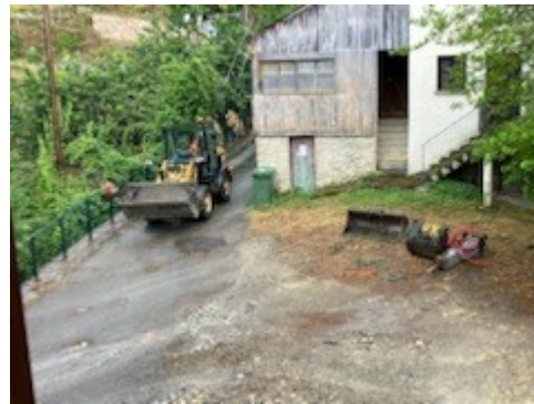
rénovation de l'enrobé de Terlaghja