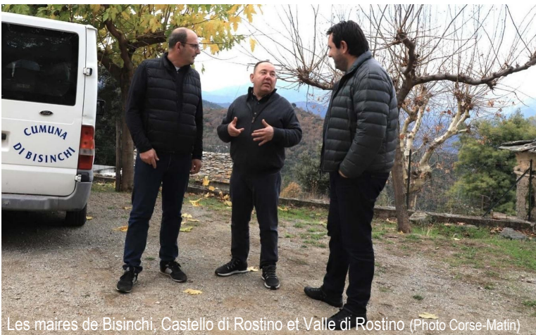
Les maires de Bisinchi, Castello di Rostino et Valle di Rostino

Les quatre communes de Bisinchi, Campile, Castello di Rostino et Valle di Rostino, ont mutualisé leurs efforts pour candidater au programme Villages d'Avenir. Elles ont obtenu le label et bénéficient ainsi, depuis le 1er janvier 2024, d'un appui en ingénierie de 12 à 18 mois.