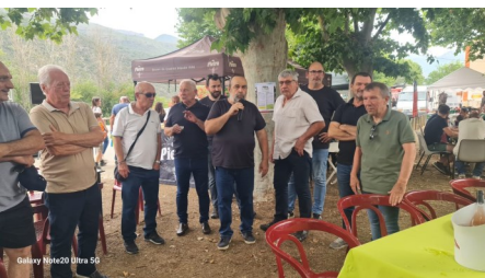
Discours d'inauguration de la Foire par le président Jean BRIGNOLE